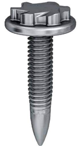
FDS® M4 hochfest