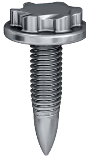
FDS® M5 Standard

Diese Leichtbaukonzepte erfordern den verstärkten Einsatz höherfester Bleche mit Zugfestigkeiten > 600 MPa. Für diesen Einsatzzweck hat EJOT eine FDS® M4 Schraube entwickelt, die den hohen Anforderungen dieses Materials gerecht wird und darüber hinaus auch direkt zur Gewichtseinsparung beiträgt.