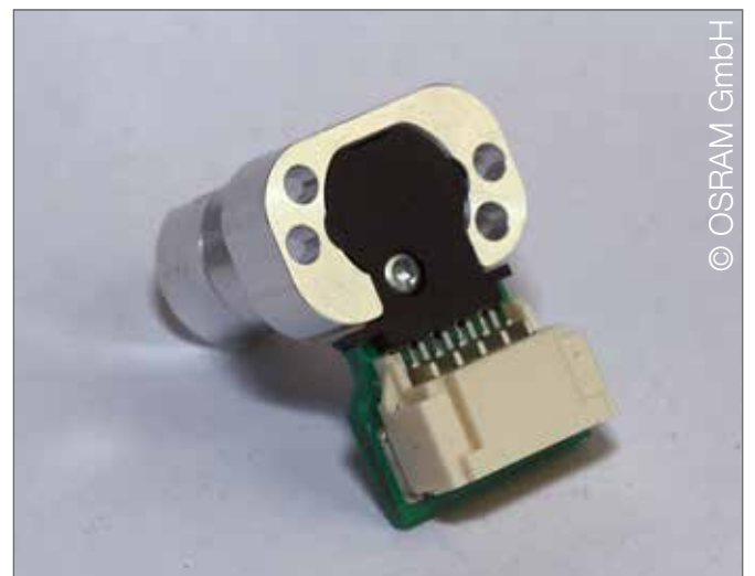
Anwendung in miniaturisiertem laseraktiviertem Remote-Phosphor-Gerät µLARP (Laserlicht für PKWs)

Aufgrund der gewindefurchenden Geometrie der EJOT® Mikroschrauben sind selbst bei hochbeanspruchten Bauteilen Einlegeteile oder Inserts überflüssig. Auch schwierige Vorarbeiten, wie beispielsweise Gewindeschneiden, entfallen beim Einsatz der Kleinstschrauben. Durch ihre individuellen, speziell auf die verwendeten Werkstoffe abgestimmten Gewindegeometrien sind sie weitgehend material-unabhängig einsetzbar. Zudem sind sie aufgrund ihrer Reparaturfähigkeit die bessere Alternative zu Löten, Kleben, Klipsen oder Schweißen.